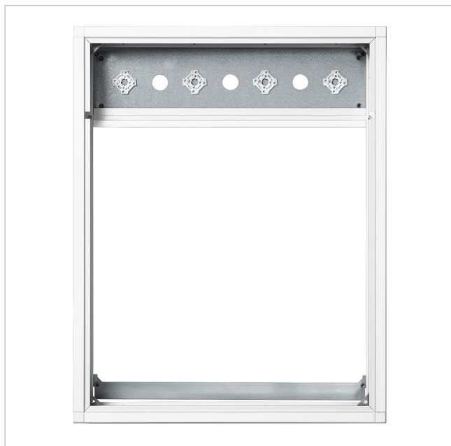
Cadre combiné KR 614-1/1 SM