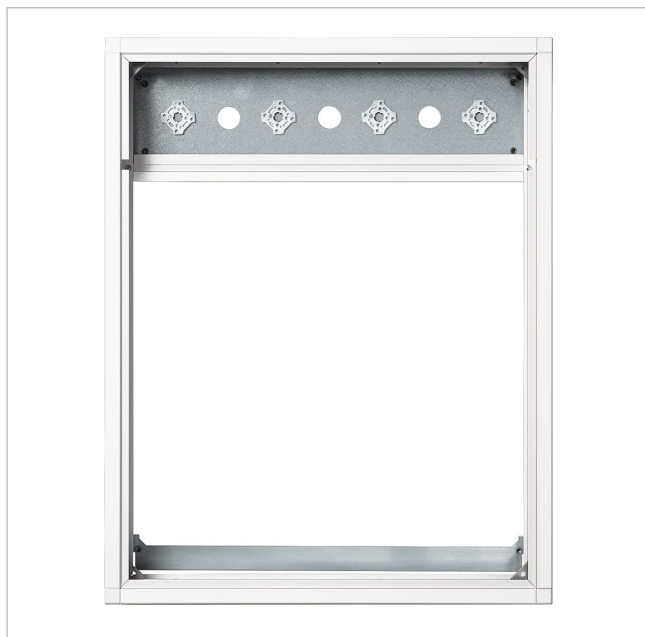
Cadre combiné KR 614-1/1 W 200040852-00