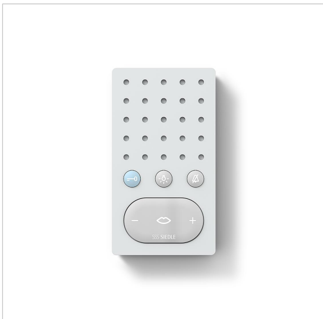
Højtalende standard- bustelefon BFS 850-02 W 200040000-00