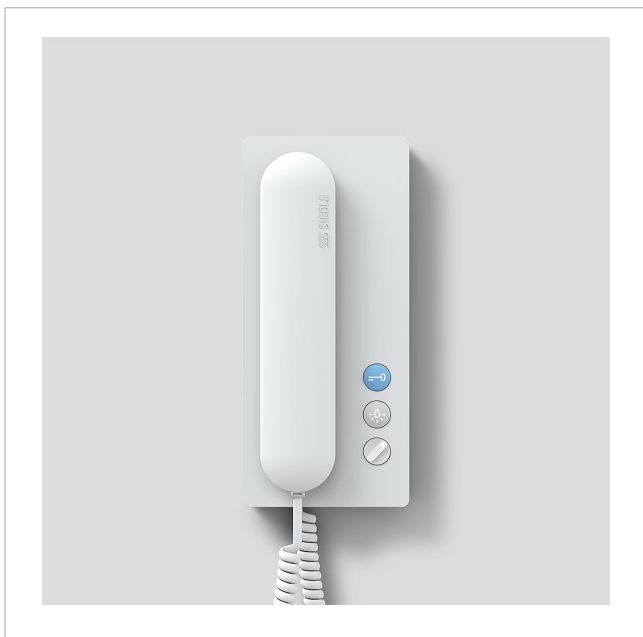
Hustelefon Analog HTA 811-0 W 200039976-00