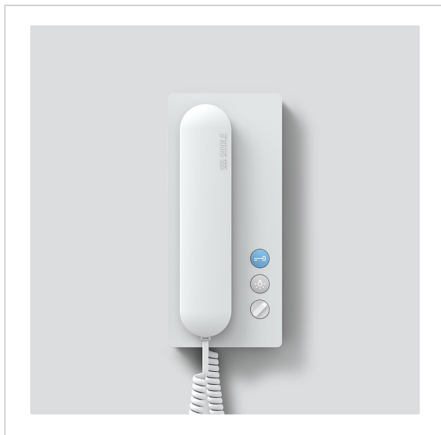
Citofono di sistema analogico HTA 811-0 W 200039976-00