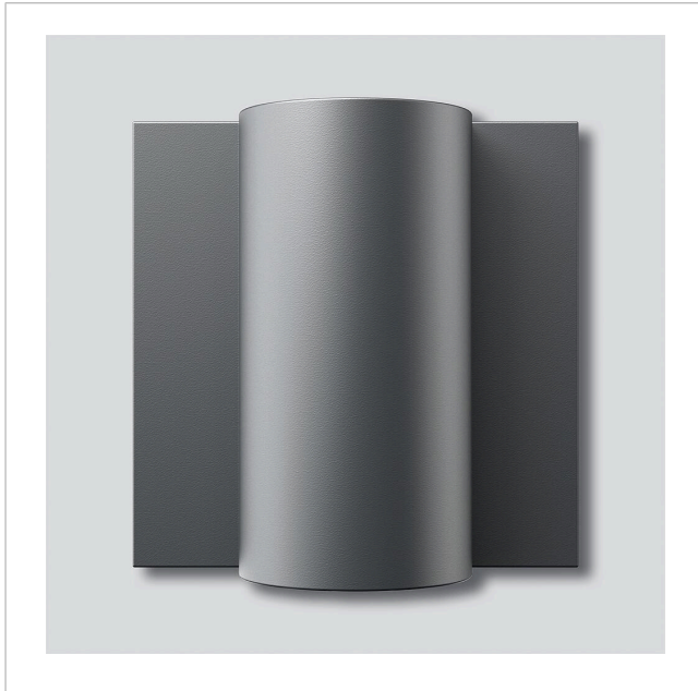
LED-Spot LEDS 600-0 DG 200038909-00