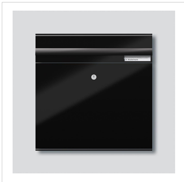
Briefkasten-Modul mit Einwurfklappe BKM 611-4/4-0 SH 200038871-00