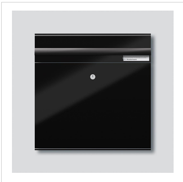
Postkassemodul med brevklap BKM 611-4/4-0 SH 200038871-00