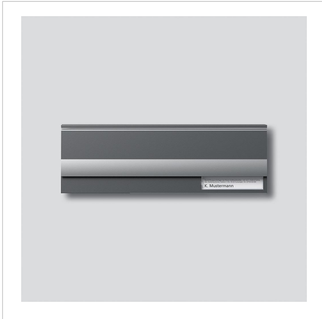
Modulo ribaltina per lettere BE 611-3/1-0 DG 200038865-00