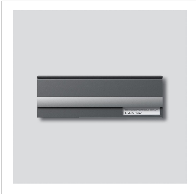
Module clapet de boîte aux lettres BE 611-3/1-0 DG 200038865-00