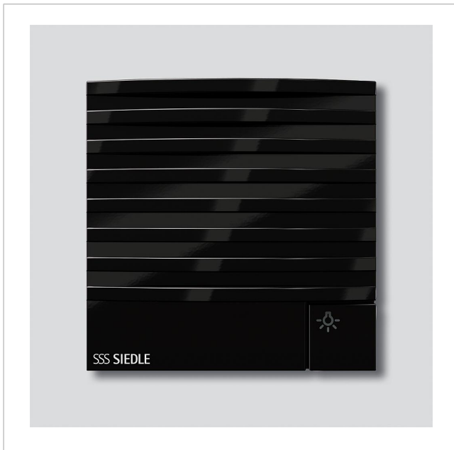
Module portier électrique bus BTLM 650-04 SH