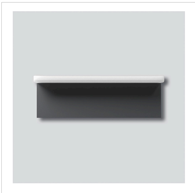
Proiettore per luce diffusa LED LEDF 600-3/1-0 DG 200038486-00