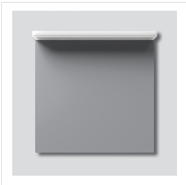
Proiettore per luce diffusa LED LEDF 600-3/3-0 SM 200037344-00