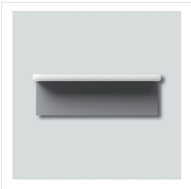
Proiettore per luce diffusa LED LEDF 600-3/1-0 SM 200037332-00