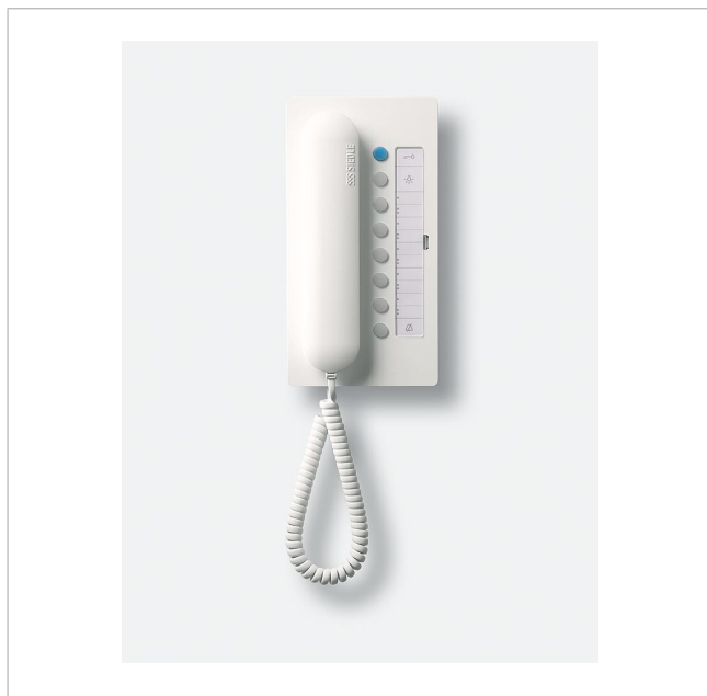
Multi-telefon HT 840-0 W 200034629-00