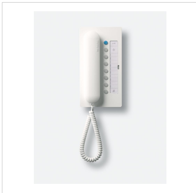
Poste Multi HT 840-0 W 200034629-00