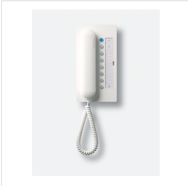
Poste Multi HT 840-0 W