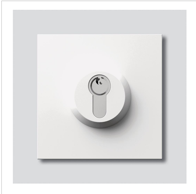
Slot-module SM 611-01 W 200019404-01