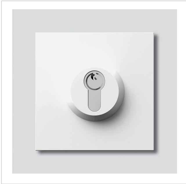
Slot-module SM 611-01 W 200019404-01