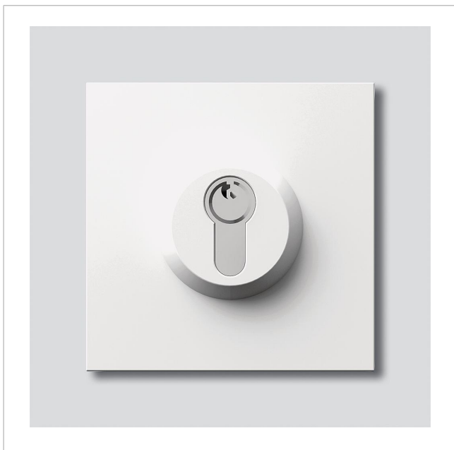
Modulo selettore a chiave SM 611-01 W 200019404-01