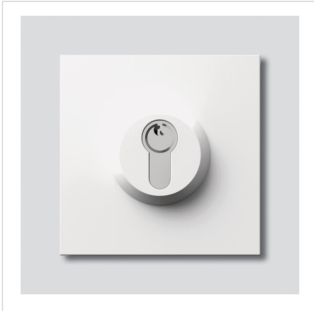
Schloss-Modul SM 611-01 W 200019404-01