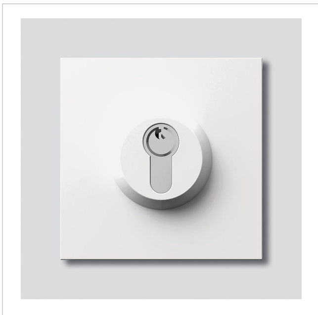
Låsemodul SM 611-01 W 200019404-01