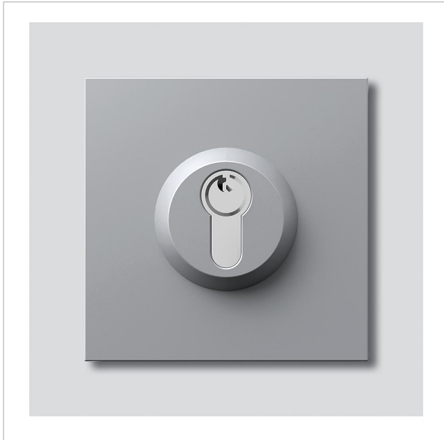
Slot-module SM 611-01 SM 200019402-01