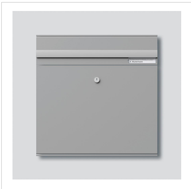
Postkassemodul med brevklap BKM 611-4/4-0 TM 200017770-01