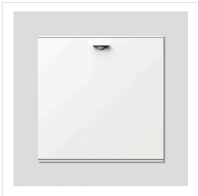
Deponeringsmodul AFM 611-4/4-0 W 200017499-00