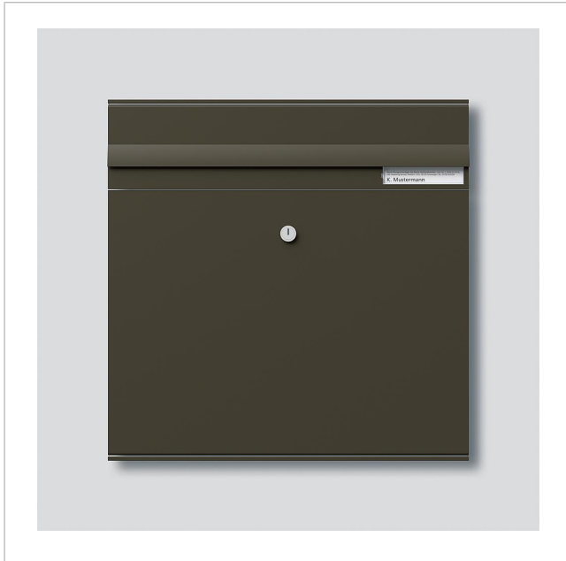
Briefkasten-Modul mit Einwurfklappe BKM 611-4/4-0 GM