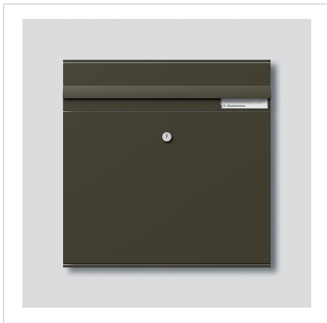
Postkassemodul med brevklap BKM 611-4/4-0 GM 200017495-01