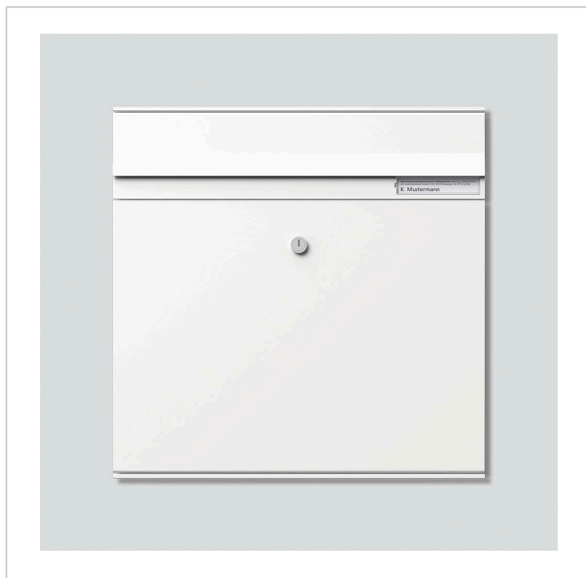
Brevlådamodul med Brevklaff BKM 611-4/4-0 W 200017493-01