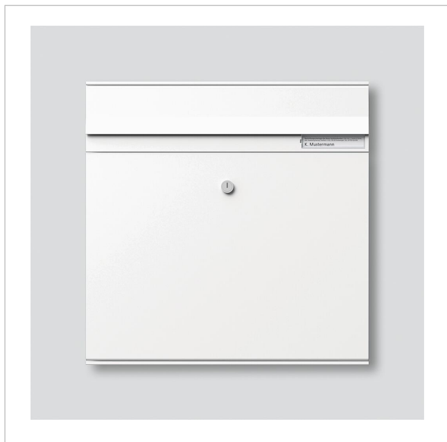
Brievenbusmodule met inwerpklep BKM 611-4/4-0 W 200017493-01