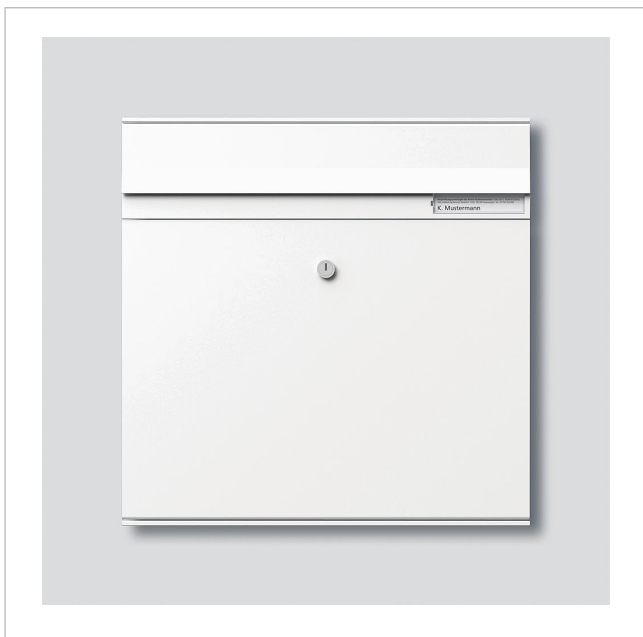
Postkassemodul med brevklap BKM 611-4/4-0 W 200017493-01