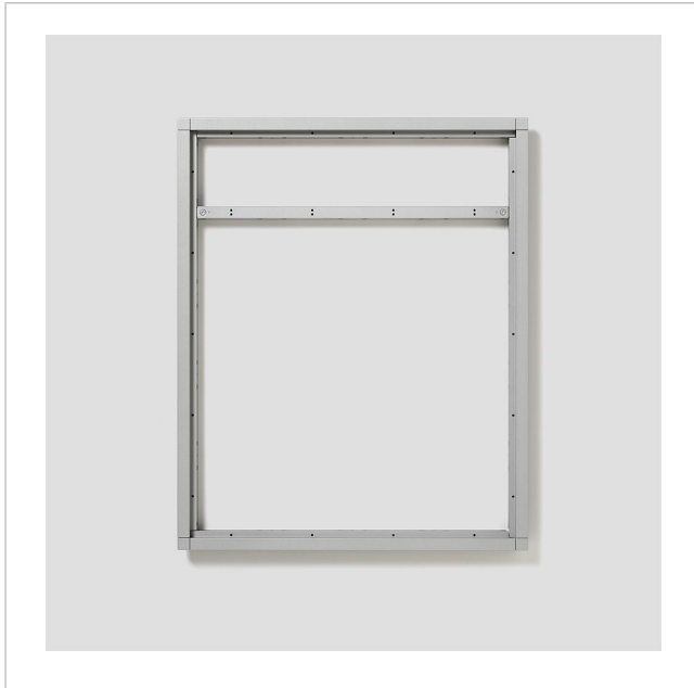
Cadre combiné KR 611-5/4-0 SM