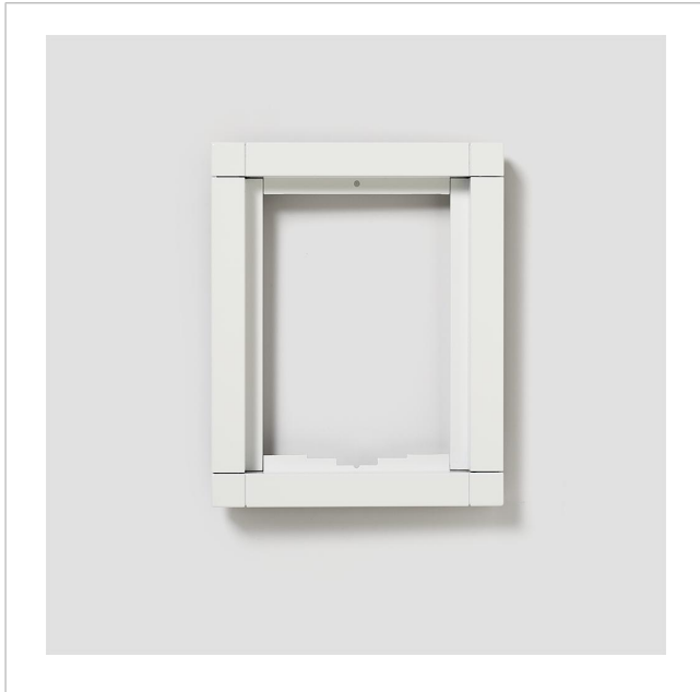
Kombirahmen KR 611-1/1-0 W