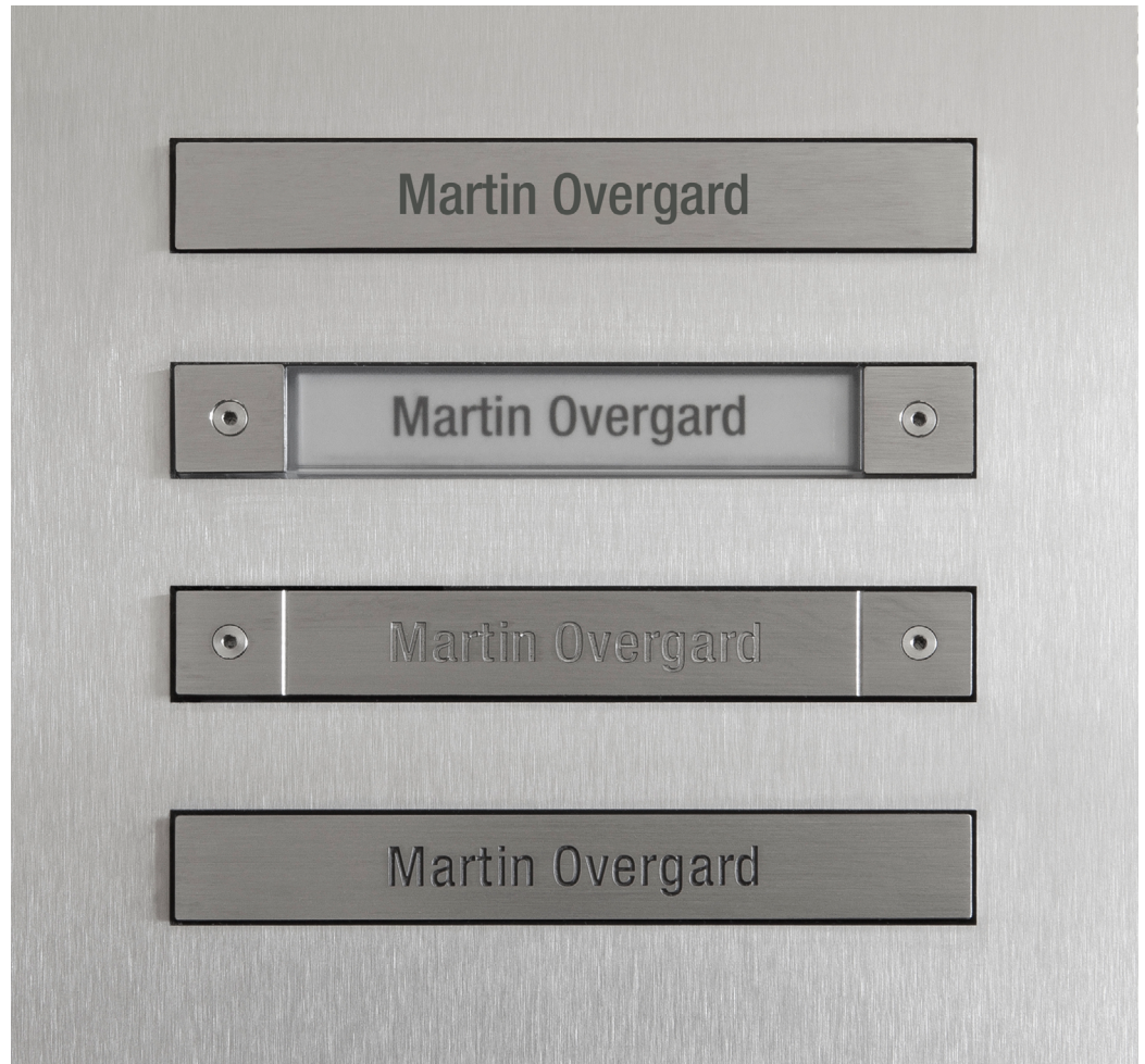
Original skrift, original størrelse