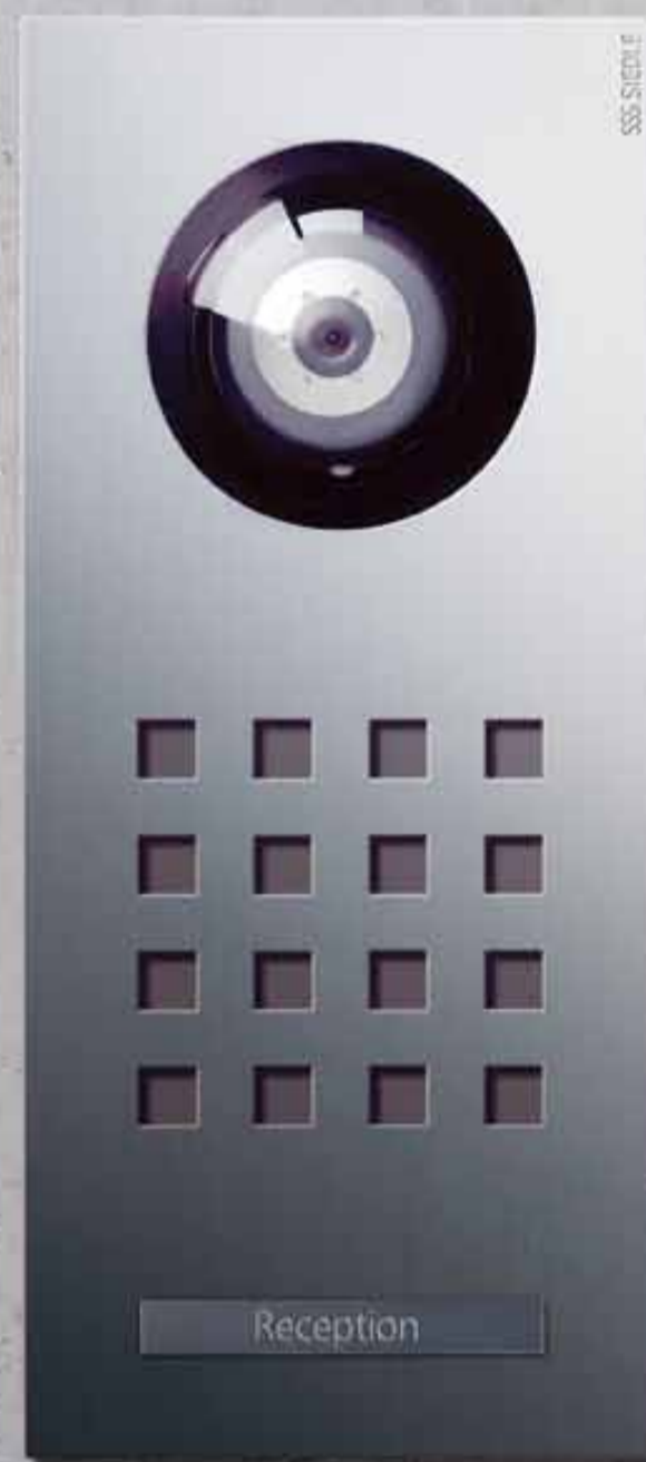
Dørstation Siedle Steel med videokamera, kommunikationssystem og opkaldstast; massivt, børstet ædelstål

Siedle Steel Siedle Vario Siedle Select Siedle Classic