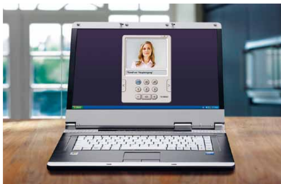
Siedle DoorCom-IP: Forbindelsen fra dør og PC

Eller prøv at forestille Dem: Dørstationen er forbundet med Deres IP-netværk. Kalde-, tale- og videosignaler fra døren overføres til nettet og modtages af en softwareklient. Pc'en overtager så alle opgaver for en svartelefon – inklusive videovisning, døråbning, koblingsfunktioner og statusmeddelelser. Det er ikke længere nødvendigt med yderligere svartelefoner – men til enhver tid muligt. For DoorCom-IP, snitfladen mellem datanet og dørkommunikation, er fleksibelt og kan skaleres.